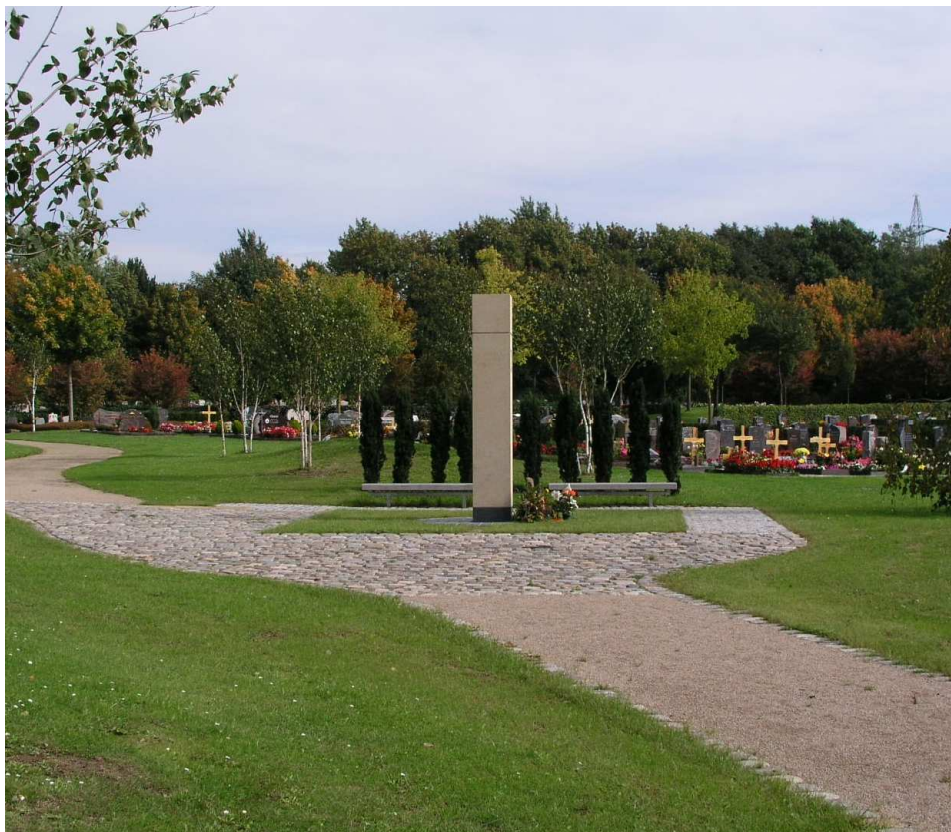
(neues anonymes Grabfeld)

Die Aschengemeinschaftsfelder befinden sich auf dem Hauptfriedhof .