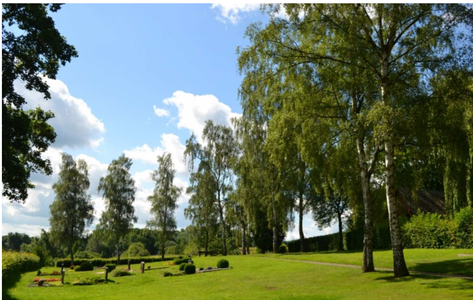
(Alter Friedhof in Kirchbauna)

Es gelten dieselben Bestattungsmöglichkeiten und Gebühren wie für die regulären Grabstätten.