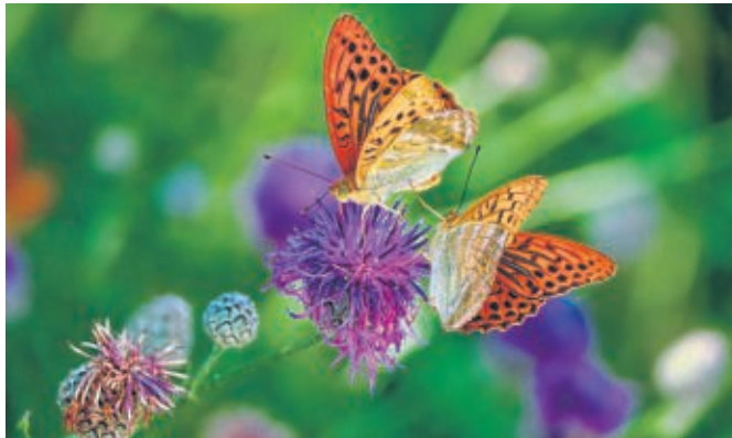
In einem naturnahen Vorgarten finden zahlreiche Insekten einen Lebensraum.

Bürger sollen für Auswirkungen von Schotterflächen auf die Natur sensibilisiert werden