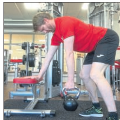
Übungstipps für das Training im Homegym

Die Kurseinheiten dauern jeweils 45 Minuten. 10 Minuten vor Kursbeginn wird der virtuelle Kursraum eröffnet. * Änderungen sind vorbehalten Wir freuen uns auf Euch. Stay fit, stay at home.