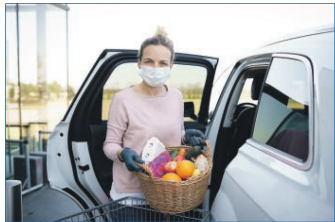
Vorsichtsmaßnahme für einen sicheren Einkauf.