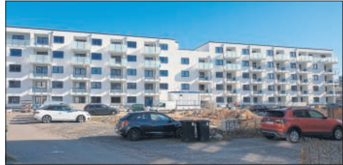
Freies Grundstück mit der Wohnanlage der HWG – Baunatal im Hintergrund.

Darüber hinaus können Bürger*innen uns GRÜNE jetzt mit ihren Fragen und Anliegen über Email - Kontakt: fragen@gruene-baunatal.de erreichen.