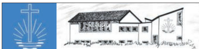
Neuapostolische Kirche Baunatal, Am Goldacker 19, 34225 Baunatal