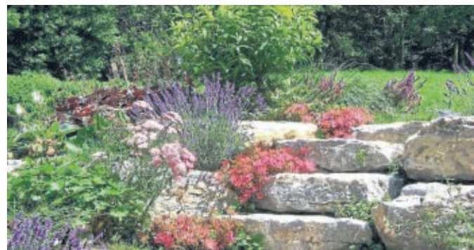
Ein traditioneller Steingarten mit farbenfrohen Blumen ist lebendig und pflegeleicht.

Königskerze, Fettehenne, Wolfsmilch, Dach- und Hauswurz, Wollziest, Mauerpfeffer, Thymian, Gras-