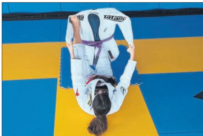
Ju-Jutsu Training mit dem Stuhl als Partner

Im Online-Training werden immer wieder neue Trainingsmethoden vorgestellt, um die Zeit bis zum langersehten Wiedersehen zu überbrücken. Ob Flaschen, Rucksäcke, Stühle oder Socken u. a. - alles findet Verwendung. Die Not macht erfinderisch. Diese alte Weisheit bewährt sich gerade mal wieder.