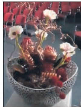
Gemeindezentrum als Lehr- und Anbetungszentrum

wenn alle freudig das gemeinsame Anbeten wieder dort aufnehmen.