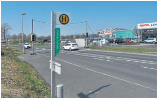
In Hertingshausen starten im Bereich Grifter Straße im Sommer umfangreiche Baumaßnahmen.

Schon seit vielen Jahren sind die Bushaltestellen und die Fußgängerampel in der Grifter Straße in Hertingshausen provisorisch eingerichtet. Nun hat die Stadt Baunatal sich entschieden, diese barrierefrei umzubauen. In Gesprächen mit der zuständigen Landesbehörde Hessen Mobil, die für die Straße zuständig ist,