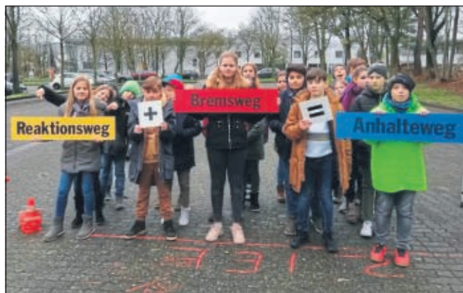
Schülerinnen und Schüler des Jahrgangs fünf der EKS während des Verkehrstrainings

Die Kinder wurden für die Gefahren im Straßenverkehr sensibilisiert. Mit einem ausgebildeten Moderator des ADAC und ihren Klassenlehrerinnen und Klassenlehrern hatten die Jungen und Mädchen die Gelegenheit, neben theoretischem Unterricht, die Gefahren im Straßenverkehr spielerisch zu erleben. Ziel war es, dass die Schülerinnen und Schüler den Zusammenhang zwischen Reaktionsweg, Bremsweg und Anhalteweg erkennen. Den Höhepunkt stellte das Erleben einer Vollbremsung als Beifahrer/in im ADAC-Aktions-Auto dar. Dabei sollte den Kindern die Notwendigkeit der richtigen Sicherung im Auto vor Augen geführt werden.