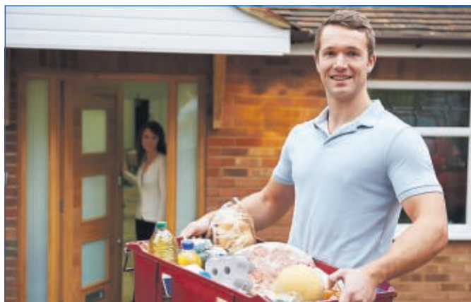
Lieferung direkt vor die Haustür

Eine allgemeine Pflicht zum Tragen von Schutzmasken sieht die Verordnung nicht vor, jedoch wird dringend zum Tragen von Mund-Nasen-Bedeckungen geraten.