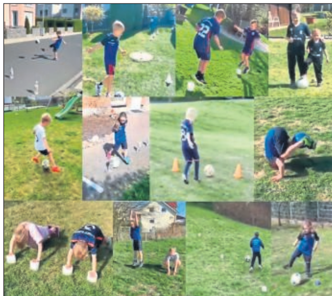
Ausschnitte aus den 12 Videos der GSV G1-Junioren

Die Betreuer bedanken sich daher bei Allen, die bei dem Wettbewerb dabei waren. So wie es aussieht, wird die trainings- und spiellose Zeit noch etwas andauern. Daher kann es sein, dass die G1 mit allen Kindern in naher Zukunft nochmal so einen Wettbewerb durchführen wird. Aber vor allen Dingen freuen wir uns alle auf den Tag, wenn wir wieder gemeinsam trainieren und Fußball spielen können. Miteinander Füreinander.