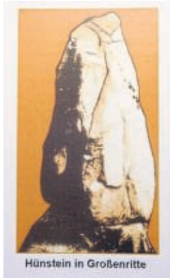
Hünstein in Großenritte