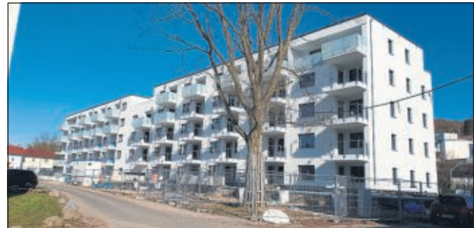
Mietgebäude der AWO „Wohnen mit Service“.