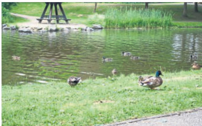
Enten brauchen zu keiner Jahreszeit zusätzliche Nahrung.

Der Frühling lockt in die Natur. Ein Spaziergang stärkt das Immunsystem und viele Menschen nutzen insbesondere in diesen Zeiten einen kleinen Ausflug an der frischen Luft für etwas Ablenkung. Einige Spaziergänger nutzen den Spaziergang allerdings dazu, Enten und anderer Wasservögel beispielsweise am Leiselsee und am Stadtparkteich zu füttern. Dabei steht vorzugsweise altes Brot auf dem Speiseplan der scheinbar stets hungrigen Vögel. Doch diese zusätzlichen „Mahlzeiten“ sind unnötig und sogar schädlich.