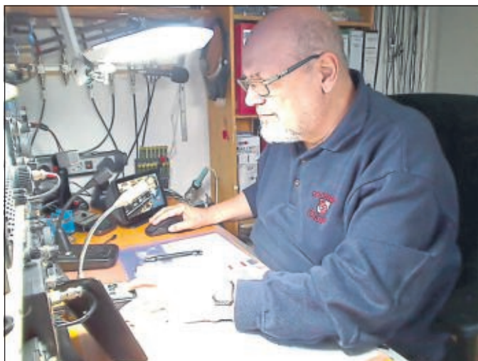
Wolfhard (DO5WE) beim OV-Abend on Air

37 Teilnehmer haben bestätigt. Für das erste Mal eines solchen OV-Abends ein toller Erfolg und es macht Lust auf ein nächstes Mal.