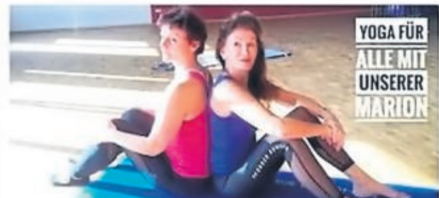
Tolle Übungsvideo's auf unserem YouTube-Kanal