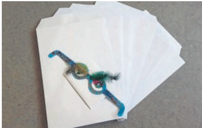
Die Briefe wurden von den Mitarbeitern des Stadtteilzentrums vorbereitet und verteilt worden.

Tipps gegen Langeweile und Bastelprojekte vom Stadtteilzentrum