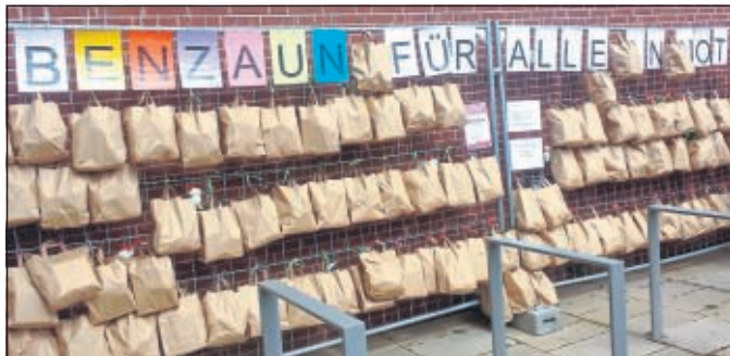
Gabenzaun für alle in Not

Auf unserer Homepage http://spd-altenbauna.de können Sie sich zu jeder Zeit ebenfalls informieren oder uns per E-Mail infomail@spd-altenbauna.de kontaktieren. Sie erhalten immer eine Antwort.