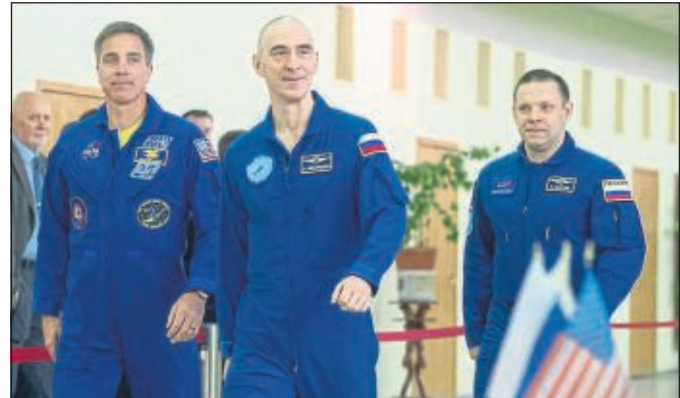
Die neue ISS-Crew

sebeschränkungen aufgrund der COVID-19-Pandemie wird Cassidy Familie von zu Hause aus zusehen, wenn er am 9. April abhebt. „Es wird völlig still sein“, sagte Cassidy in einem Satelliteninterview von Spaceflight Now aus Star City, Russland. „Es wird niemand da sein.“ Ein NASA-Protokoll ist seit langem in Kraft, um Astronauten daran zu hindern, Krankheitserregern ins All zu tragen. Alle Astronauten, die in die Umlaufbahn fliegen, müssen eine zweiwöchige „gesundheitsstabilisierende“ Quarantänezeit durchlaufen. Auf diese Weise kann die NASA sicherstellen, dass die Besatzung vor dem Start keine Krankheiten ausbrütet. Die NASA sagte, dass sie „diesen Plan in Abstimmung mit ihren internationalen und kommerziellen Partnern weiter evaluieren und bei Bedarf ergänzen wird“.