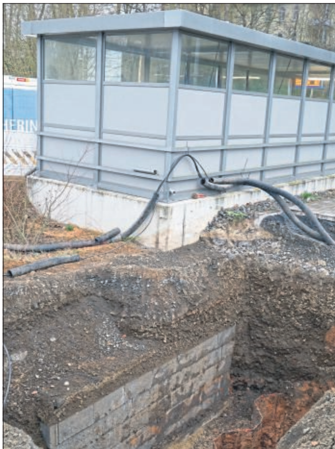
Gut vorbereitet worden war der Einstieg zum Fahrstuhl am Gleis 4 bereits in der ersten Ausbaustufe.

Mit den kommunalen Zuschüssen sind damit lange gehegte Wünsche nicht nur für Guntershäuser Bahnnutzer wahr geworden, die seitens der SPD über Jahre mit Nachdruck unterstützt worden waren.