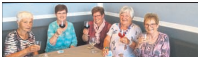
2019 Gemütliche Runde im Nordseehotel in Friedrichshafen