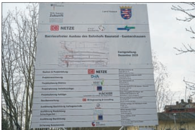
Endlich ist es soweit - mit Fahrstühlen und Rampen wird der barrierefreie Ausbau des Bahnhofes Guntershausen abgeschlossen.