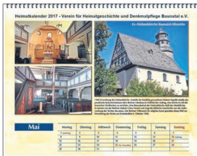
Aus Heimatkalender 2017

Feste Sitten und Regeln gab es beim Kirchgang und Abendmahl. Getrennt nach Geschlecht saßen, in Richtung Altar gesehen, die Männer auf der linken und die Frauen auf der rechten Seite. Es war selbstverständlich, dass am Sonntag von jeder Familie ein Mitglied am Gottesdienst teilnahm. Musikalisch umrahmt wurden die kirchlichen Feiern neben dem Orgelspiel oft von einem Kirchen- und einem Posaunenchor.