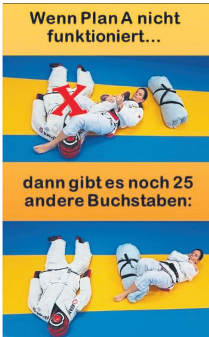
So wird z. B. deine Bettdecke zum Trainingspartner.

Es gibt immer einen Weg. Wir freuen uns sehr, wenn du Kontakt zu uns aufnimmst.