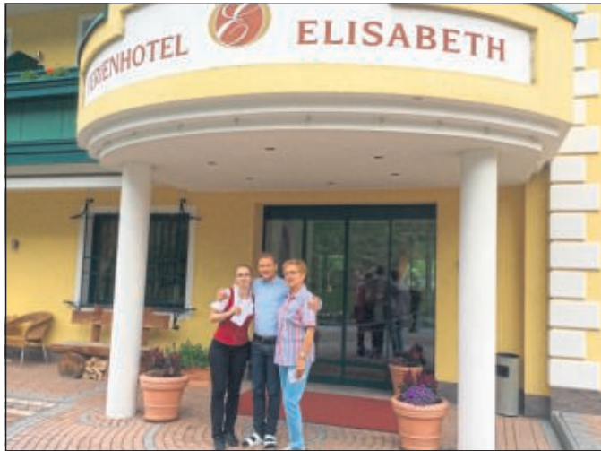
2018-Abschied von unserem Ferienhotel Elisabeth in Werfenweng.