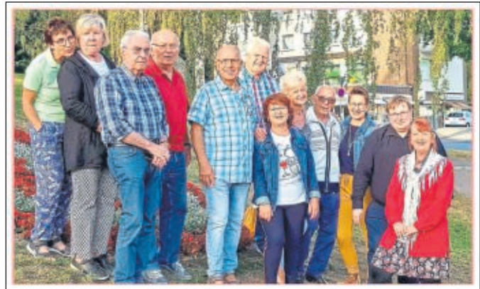
der Vorstand des Ortsvereins der SPD Altenbauna hofft auf ein baldiges Ende der Pandemie

Auf unserer Homepage http://spd-altenbauna.de können Sie sich zu jeder Zeit ebenfalls informieren oder uns per E-Mail infomail@spd-altenbauna.de kontaktieren. Sie erhalten immer eine Antwort.