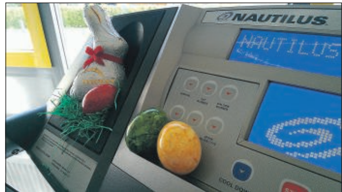
Wir wünschen schöne Ostern.