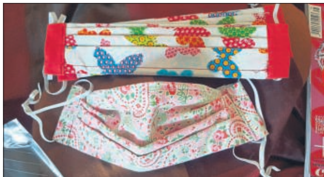
So bunt und schön sehen die Großritter Schnuddeltücher aus.