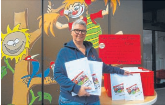
Das Team der Augustine hatte 200 Überraschungspakete für die Baunataler Kinder gepackt.

Spielmobil Augustine verteilt Überraschungspakete an Kinder - neue Aktion am 9.4.