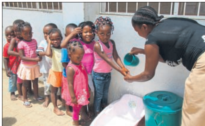
tdh hilft bei Corona-Pandemie