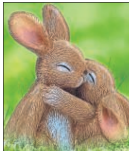
Ein gesundes Osterfest