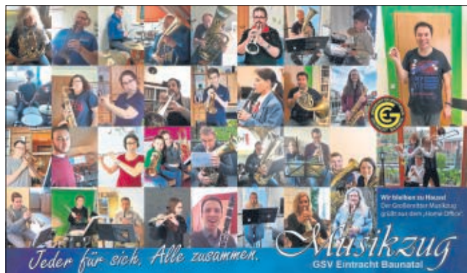
Die Musiker des Musikzugs beim Üben.

Bis dahin wünscht der Musikzug Ihnen viel Gesundheit und ein schönes Osterfest.