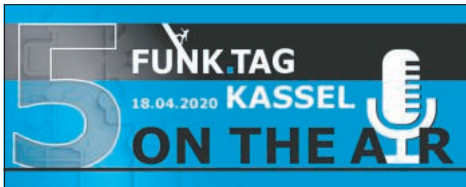
FUNK.TAG on the air

FUNK.TAG on the air: DARC e.V. ruft am 18. April zum Contest auf