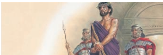
ANTWORTEN AUF FRAGEN ZUR BIBEL -

Wenn es an der Haustür klingelt, ist es vielleicht der Paketbote oder in München das Tropeninstitut mit Polizei für die große Stichprobenstudie, um mehr über die Verbreitung des neuen Coronavirus und die Dunkelziffer der Infizierten zu erfahren. Aber es sind nicht mehr Jehovas Zeugen. Aufgrund der Corona-Krise gehen die Baunataler Jehovas Zeugen wie auch im ganzen Bundesgebiet vorerst nicht mehr von Tür zu Tür und haben aus Sicherheitsgründen dies komplett eingestellt. Genauso wie sie auch schon vor dem offiziellen Versammlungsverbot nicht mehr persönlich für Gottesdienste zusammenkommen. Auf der Internetplattform Zoom und per Telefon übertragen die Baunataler jetzt ihre Gottesdienste. Auch Vorträge werden ins Internet gestellt. Das Lösungsangebot für das Versammlungsverbot kommt bei den Baunataler Zeugen sehr gut an. So haben sie die Möglichkeit trotz der schwierigen Situation in Kontakt zu bleiben. Dabei ist jeder eingeladen, sich an den freien Tagen etwas Zeit zu nehmen, sich allein oder im Kreis der Familie Videoaufnahmen von Gottesdiensten auf der Webseite von jw.org anzusehen sowie das Video „Warum starb Jesus?“.