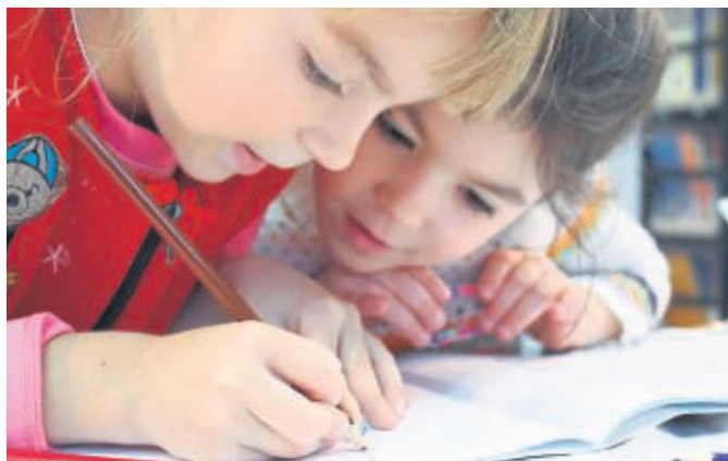
Es gibt viele sinnvolle Herausforderungen für die Kinder in der unterrichtsfreien Zeit.

Seit dem 16. März sind beinahe alle Schulen in Deutschland bis zum Ende der Osterferien geschlossen. Die Kinder müssen größtenteils zu Hause betreute werden, viele sogar gleichzeitig beim Arbeiten im Home Office. Zudem machen sich viele Eltern Sorgen, dass der vorgesehene Schulstoff wegen der fehlenden Schulwochen nicht geschafft wird. Wo es möglich ist, werden Lehrer den Eltern Lernmaterial und Arbeitspläne zu Hand geben.