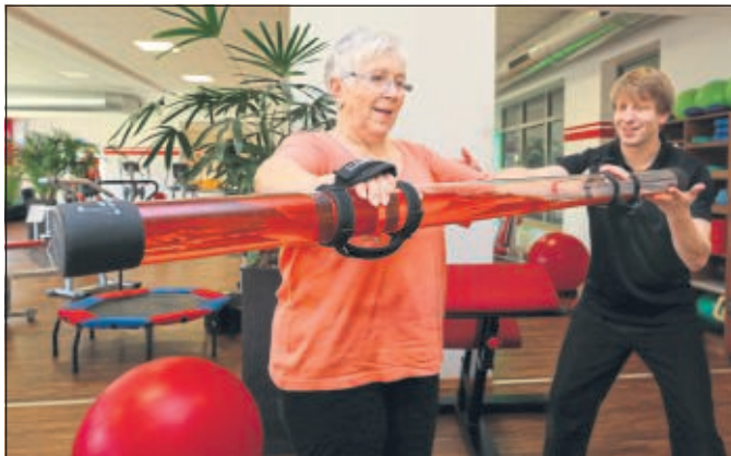
Präventionskurse starten später