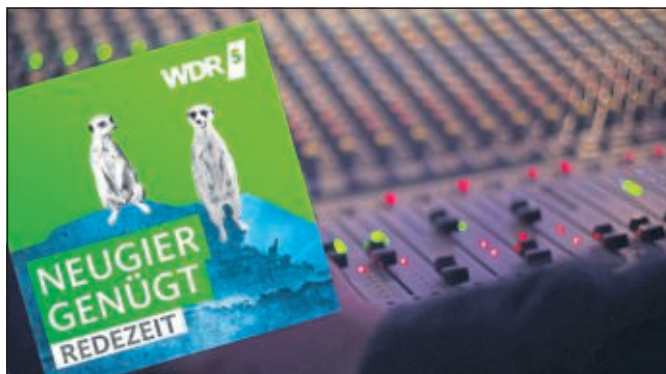
Amateurfunk im Radio

DARC-Info: Unser Ortsverband ist einer von über 1.000 Ortsverbänden des Deutschen Amateur-Radio-Club e.V., dem größten Verband von Funkamateuren in Deutschland und die drittgrößte Amateurfunkvereinigung weltweit. Mit über 34.000 Mitgliedern vertritt der DARC die Interessen der über 67.500 Funkamateure in ganz Deutschland und engagiert sich bei der Förderung des Amateurfunks auf allen Ebenen – auch international. Informationen gibt es im Internet unter www.darc.de oder telefonisch unter 0561-94988-0