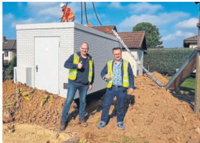
Pop-Aufstellung in Hertingshausen.

Bis Redaktionsschluss lagen keine Angaben darüber vor, ob die Arbeiten in Hertingshausen wegen der Coronakrise ausgesetzt werden. Kurzentschlossene haben die Möglichkeit, während der Bauphase noch einen Vertrag abzuschließen.