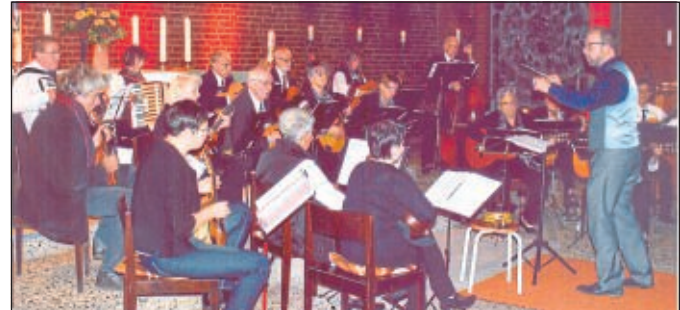
Mandolinen- und Gitarrengemeinschaft Nordhessen