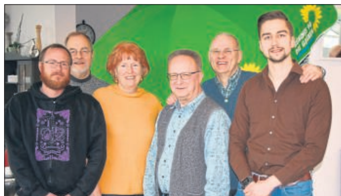
Wir sind für Sie da! Teile des Vorstands der GRÜNEN Baunatal

Besuchen Sie unsere Homepage: www.gruene-baunatal.de und auf Facebook / GrueneBaunatal für weitere Meldungen.