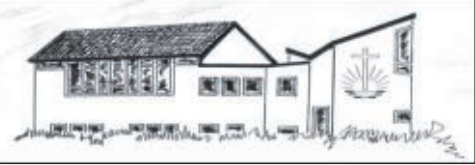
Neuapostolische Kirche Baunatal, Am Goldacker 19, 34225 Baunatal