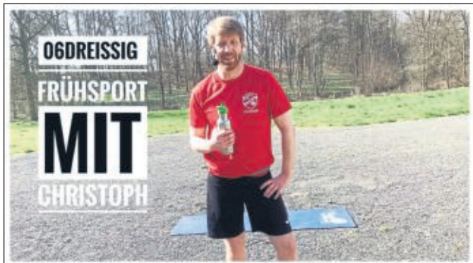
Online-Angebot auf Youtube