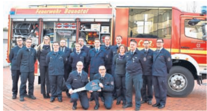
Freude bei den Kameraden aus Rengershausen über ihr neues Löschfahrzeug. Auch ein neues Wechselladerfahrzeug mit Abrollbehältern wurde der Baunataler Feuerwehr übergeben.

Der Stadtbrandinspektor betonte, bürgerschaftliches Engagement und ehrenamtliche Arbeit seien nicht