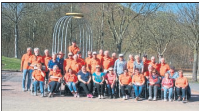
Blick auf die Teilnehmer unseres Frühjahrsturniers 2018

Aufgrund der sinnvollen Auflagen durch die Politik sowie der KSV-Vereinsführung, aber auch als Vorsichtsmaßnahme zum Gesundheitsschutz unserer Aktiven haben die Baunataler-Boule-Bärchen seit Anfang März 2020