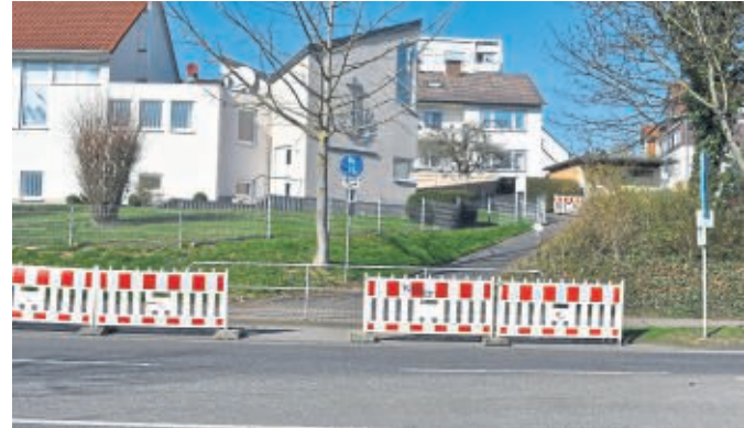
In der Altenritter Straße erfolgen Arbeiten zur Fernwärmeverlegung.

Aufgrund der Bautätigkeiten kommt es ebenfalls zu Verkehrsbehinderungen auf der Fahrspur Richtung Altenritte. Der Fußgängerüberweg über die Altenritter Straße im Bereich Baunsbergstraße wird im Zuge der Bauarbeiten komplett gesperrt. Die Fußgänger wer-