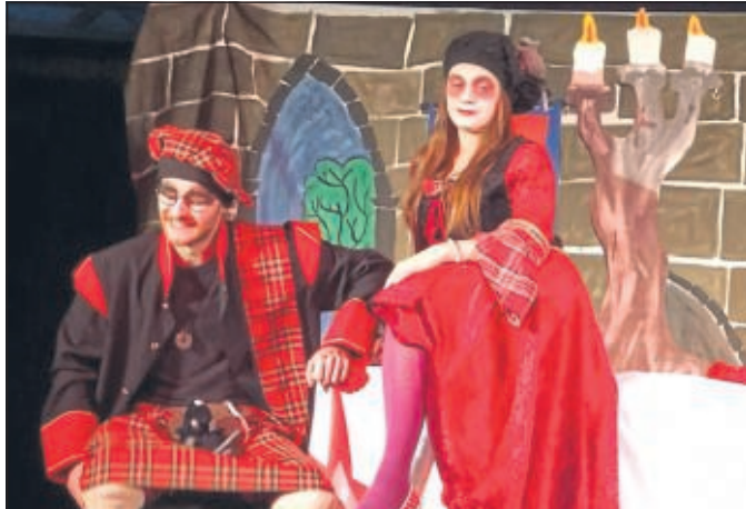
Das Phoenix Theatre in der Aula der EKS

Die EKS freut sich schon jetzt auf den Besuch des Phoenix Theatre im nächsten Jahr.